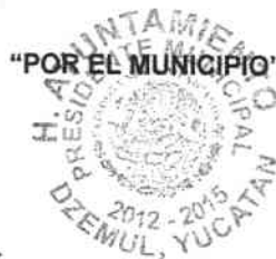
M.V.Z. DOMINGO ARGIMIRO ORTEGA GRANIEL PRESIDENTE MUNICIPAL

EL PRESENTE CONTRATO SE FIRMA EN LA LOCALIDAD Y MUNICIPIO DE DZEMUL, ESTADO DE YUCATAN, EL DIA 16 DE DICIEMBRE DEL AÑO 2013.