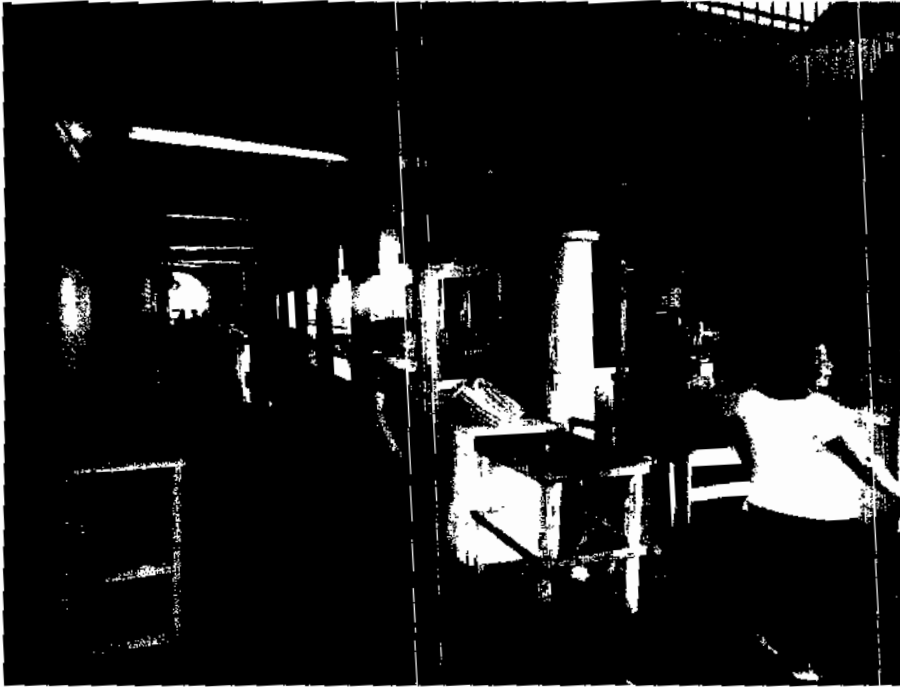
Área de frutas y verduras en el interior del mercado municipal.