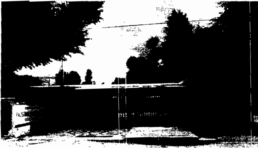
Escuela primaria Faustino García Franco.