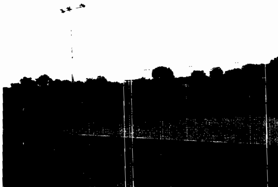
Campo de fútbol de la Unidad Deportiva de Muna.