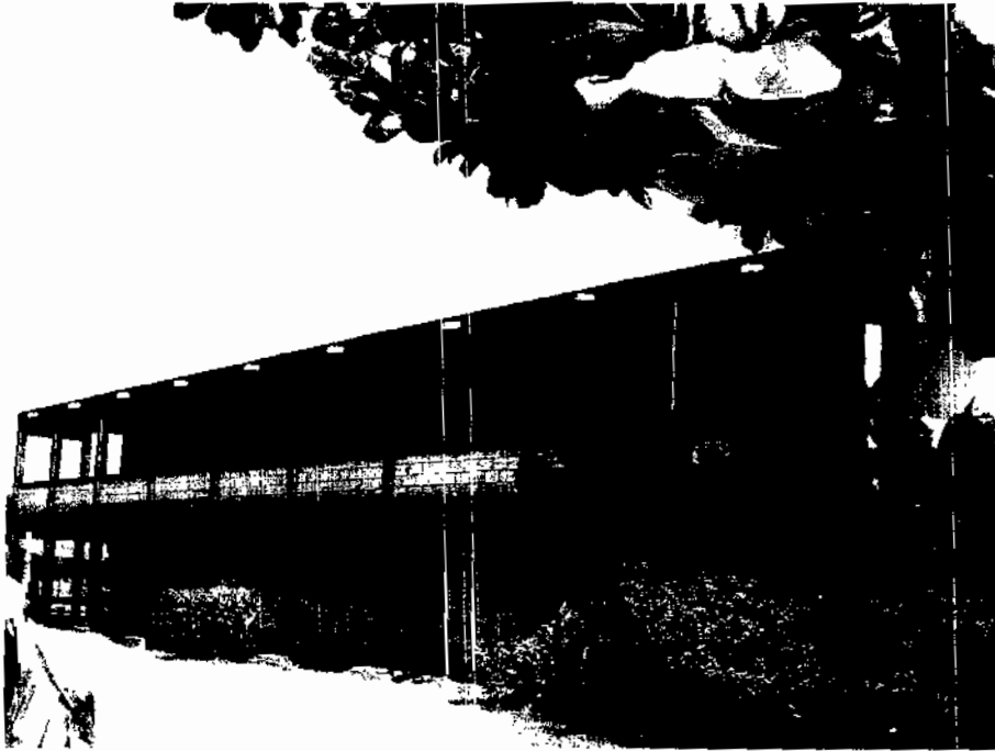
Escuela Preparatoria Muna.