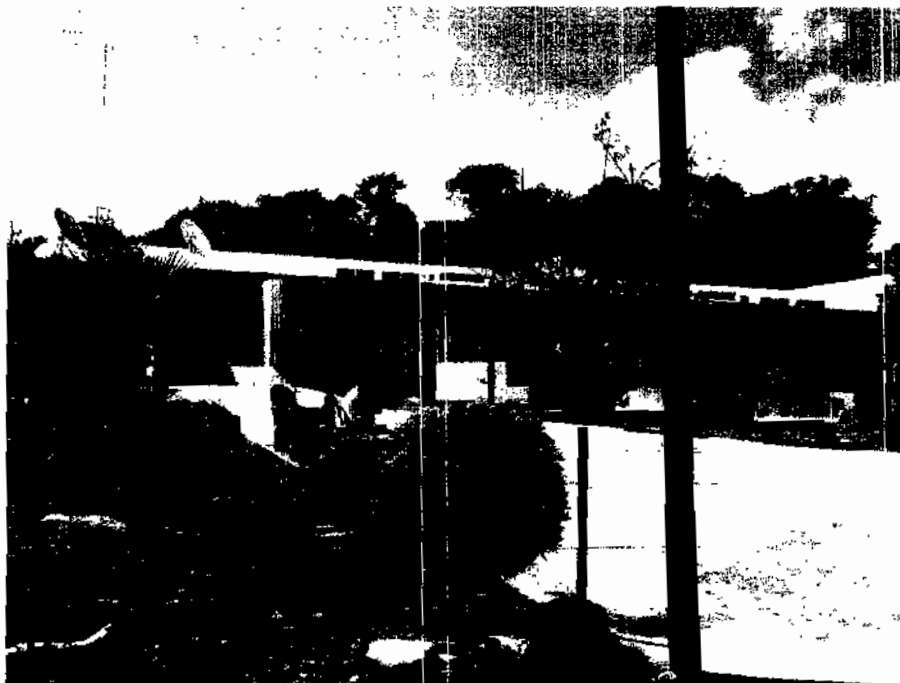
Hospital IMSS-OPORTUNIDADES del municipio de Muna.