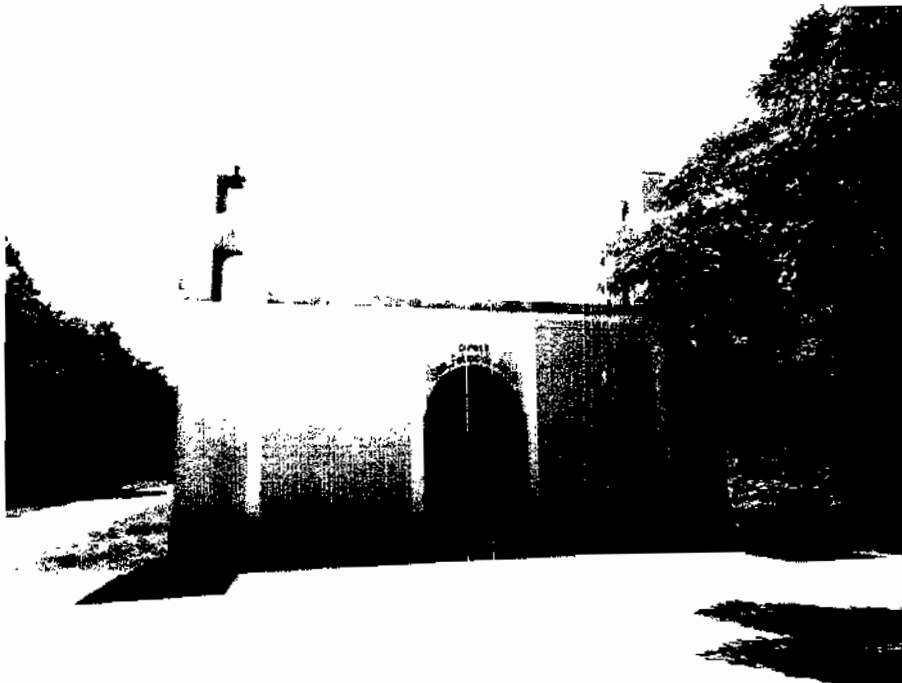
Capilla en honor a San Felipe de Jesús.