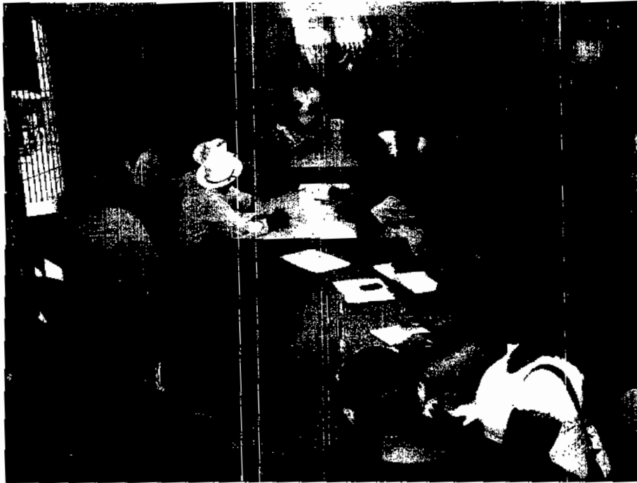
Instalación del COPLADEM del municipio de Muna.