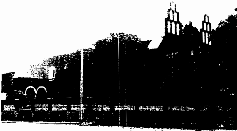
Panorámica de la Iglesia en honor a la virgen de la Asunción.