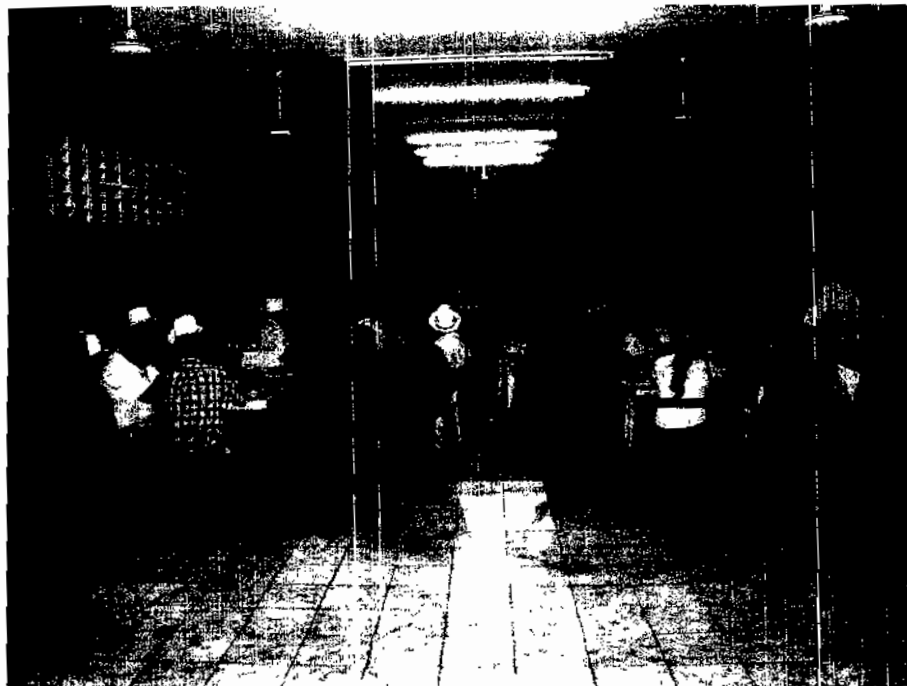
Mesas de trabajo durante el foro de consulta ciudadana.

PLAN MUNICIPAL DE DESARROLLO 2010-2012 MUNA, YUCATAN