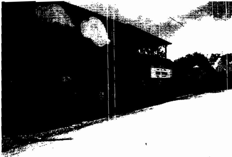
Escuela preescolar Ignacio Aldama.