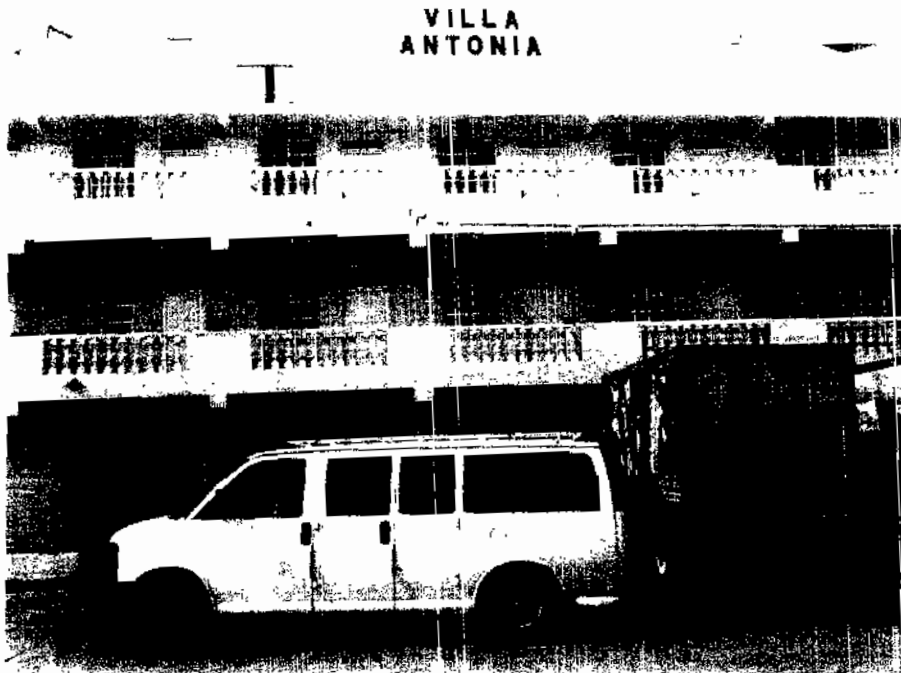
Hotel Villa Antonia ubicado en el centro de la localidad.