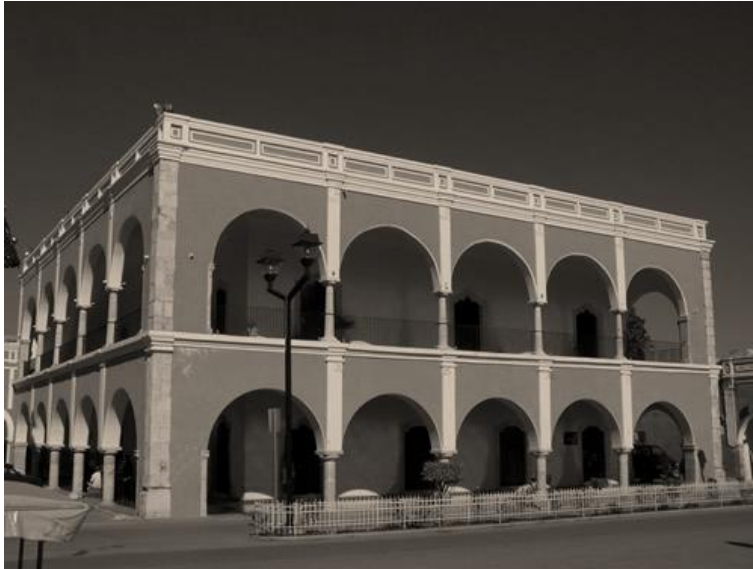
Arcos del Palacio Municipal de Tekax.

El municipio cuenta con 62 localidades, de las cuales las más importantes son: Becanchén, Kancab, Kinil, Manuel Cepeda Peraza, Mesatunich, Pencuyut, Tekax de Álvaro Obregón, Ticum, Tixcuytum, Xaya y Xcunyá.