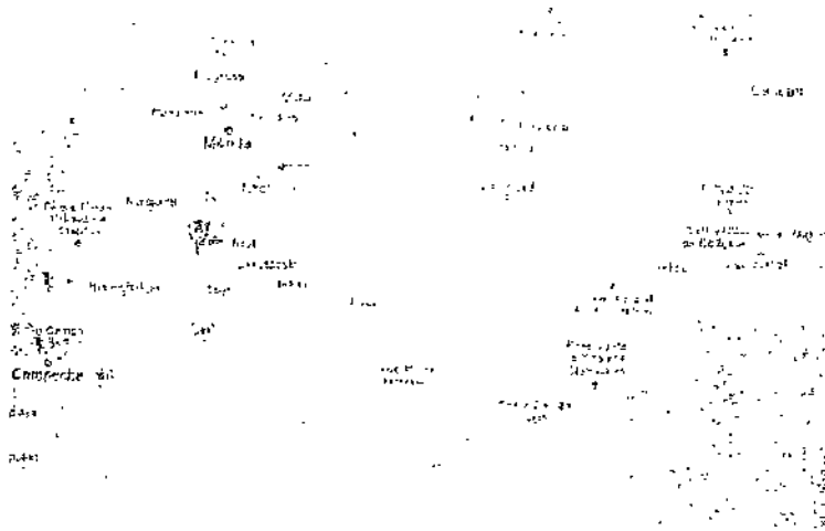
A.-MUNA YUCATAN, MEXICO.