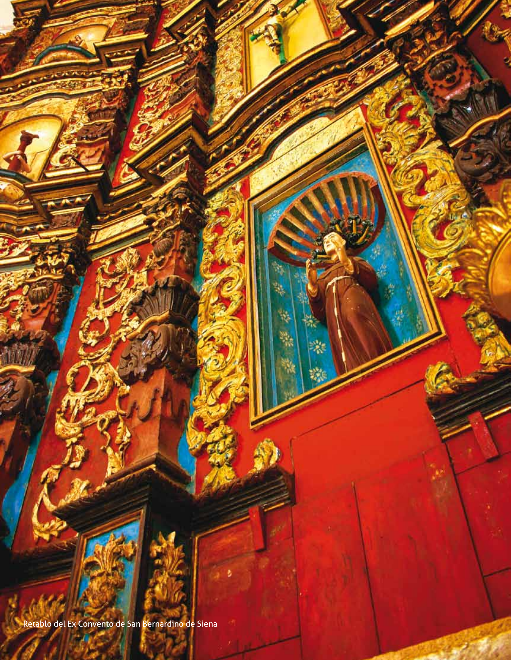
Retablo del Ex Convento de San Bernardino de Siena