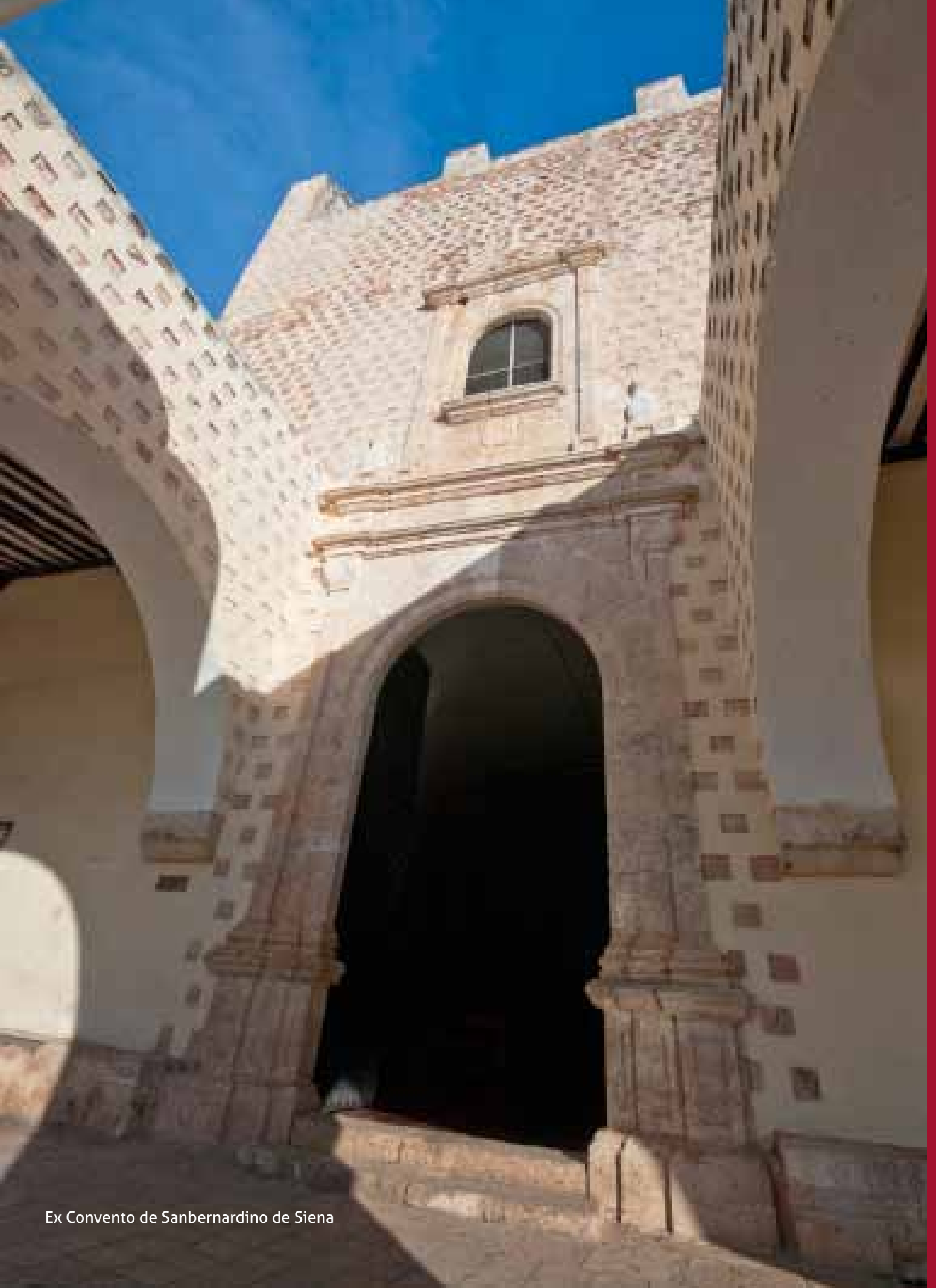
Ex Convento de Sanbernardino de Siena