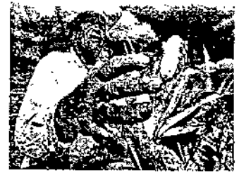
TRABAJANDO PARA TI

Artículo 97. Las faltas e infracciones a las normas establecidas en el presente Bando, Reglamentos, Circulares y disposiciones administrativas, serán sancionadas de conformidad con lo dispuesto en la Ley de Gobierno de los Municipios del Estado de Yucatán y demás leyes respectivas de conformidad con las siguientes sanciones: