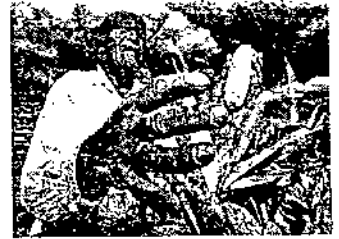
TRABAJANDO PARA TI

Los Jueces Calificadores durarán en su cargo tres años, pudiendo ser ratificados para un periodo adicional y solo serán removidos por causa grave, calificada por el Cabildo.