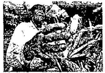
TRABAJANDO PARA TI