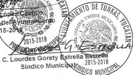
C. Lourdes Gorety Estrella Estrella Síndico Municipal