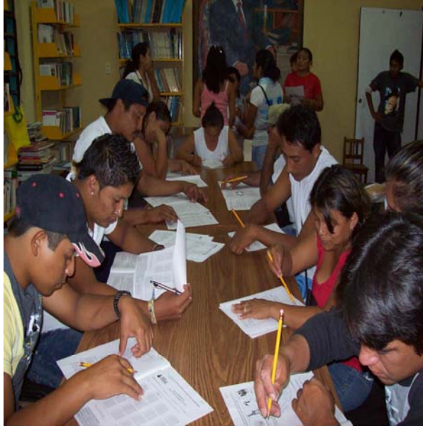
Trabajo con grupos productivos que son informantes claves de apicultura