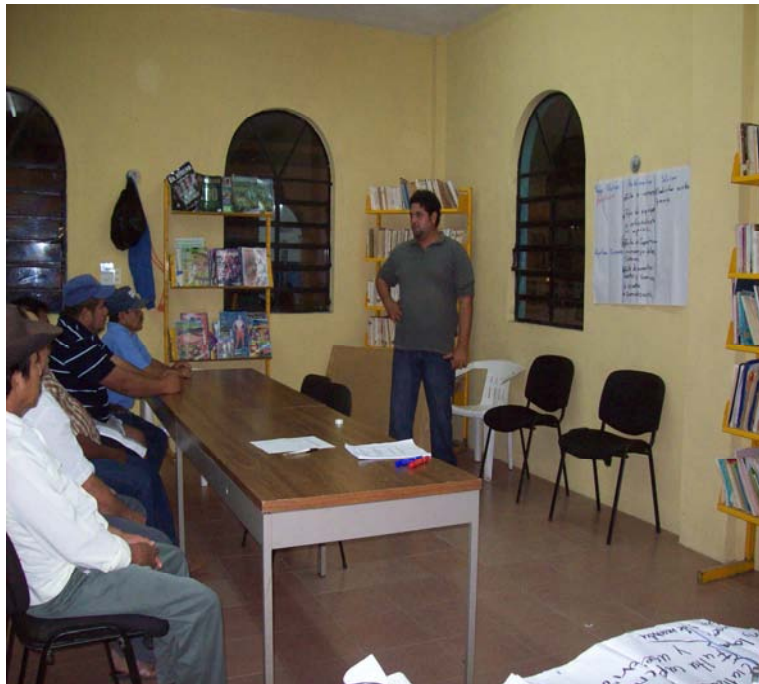
El asesor en forma de exposición encuestando a los productores de maíz

6.- FOTOS DE LOS TRABAJOS DE LOS GRUPO Y DEL CONSEJO MUNICIPAL.