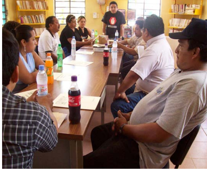
Toma de decisiones en los grupos de producción de Chapab.