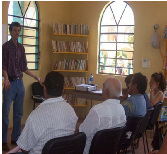
Un productor de chapab dando su punto de vista de los apoyos gestionados en cítricos